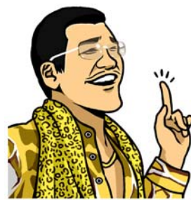
ピコ太郎に学ぶ英会話テク