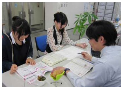
レポート学習体験